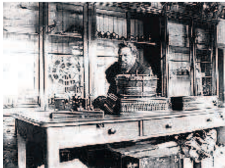
PIONJÄR. Lars Magnus Ericsson, grundaren till Telefonaktiebolaget LM Ericsson, sittande vid sitt skrivbord år 1886.