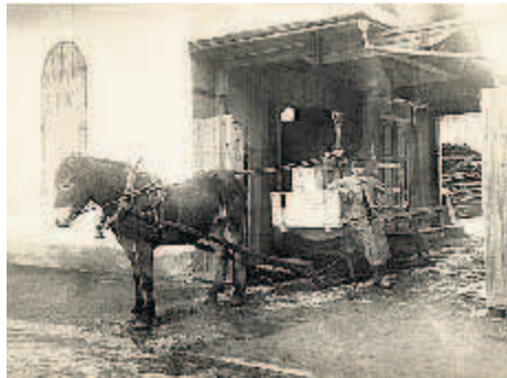
HÅST OCH VAGN. Från Hakonbolagets första lager i Karlstad 1918 skedde transporterna med häst och vagn. Bolaget uppkallades efter dess grundare Hakon Swensson och ligger till grund för dagens ICA.